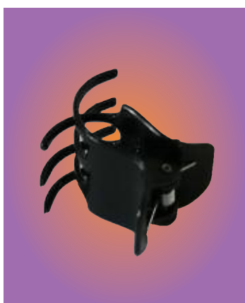
Die Mini-Haarklammern enthielten 207 ppm des bromierten Flammschutzmittels HBCD

Polybromierte Diphenylether (PBDE) sind eine Gruppe von Stoffen, die als hormonschädlich für den Menschen (endokrine Disruptoren, ED) bekannt sind. PBDE können die Funktion der Schilddrüse nachhaltig stören, die Entwicklung des Gehirns beeinträchtigen und das Nervensystem langfristig schädigen. Wissenschaftliche Untersuchungen haben einen Zusammenhang zwischen PBDE-Belastung und Aufmerksamkeitsdefiziten sowie Hyperaktivität bei Kindern (ADHS) nachgewiesen.