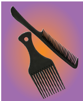
In diesen Kämmen wurde eine PBDE-Konzentration von 21 ppm (1 ppm = 1 Millionstel) gemessen